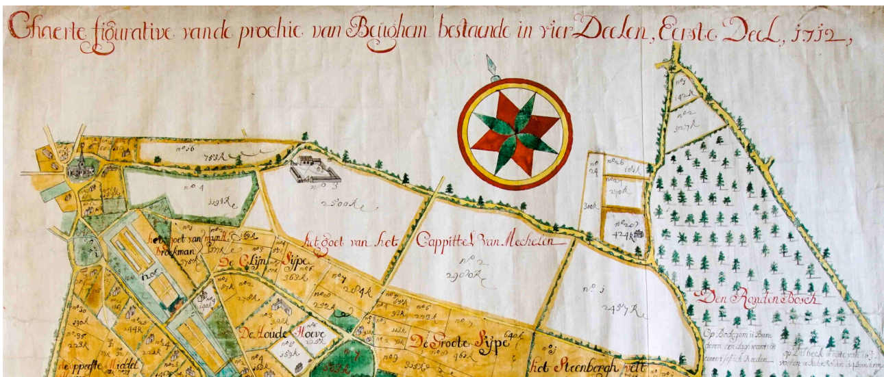
Het Personaatsgoed op de tiendekaart van het Sint-Janshospitaal (Archief OCMW-Brussel, SJ-40). Het fameuze Personaatshof is gelegen aan de opvallende knik in de straat in de richting van de parochiekerk. Deze knik werd later nog uitgesprokener door de aanleg van de huidige Bodegemstraat, voordien Brusselstraat, maar eertijds passend Personaatstraat genoemd. De macadambaan die in de zeventiger jaren van vorige eeuw werd aangelegd, loopt diagonaal overlangs het perceel nr.4 van het Personaatsgoed, d.w.z. vanaf het Personaatshof naar de ingang van het kasteeldomein dat op bovenstaande kaart 'het goet van Broeckman' wordt genoemd.

De vruchtgebruiker van het personaat is de zogenaamde persona personatus . Zijn belangrijkste geestelijke bevoegdheid is het recht om de parochiepriester aan te duiden (het zogenoemde collatierecht ). Dit recht mocht hij uitoefenen sine cura animarum , d.w.z. zonder verplichting om de plaatselijke zielenzorg op zich te moeten nemen. 3 Een personaat werd gewoonlijk dan ook toegewezen aan een seculier kanunnik, dus niet noodzakelijk een priester, maar minstens toch een geestelijke die de lagere wijdingen had ontvangen. Vanuit canoniek oogpunt stond er voor de betrokken kapittelheer zelfs niets in de weg om er een lekenactiviteit, ja zelfs een gewoon huwelijksleven, op na te houden.