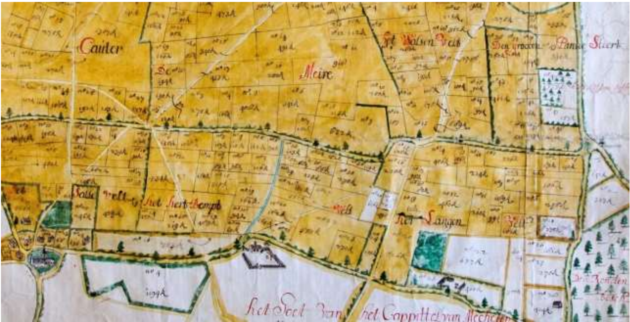
Bovenstaande tiendekaart van het Sint-Janshopsitaal (1712) toont de velden vanaf het dorpscentrum tot aan Rondenbos. In het midden onderaan herkent men het Personaatshof.

hoffstadt, haer te deele gevallen bij doode Peeters Tambuyser aen de straete commende van Bodeghem naer hoensem, de welcke bij haeren auther off van haeren twegen is affgeworpen, mitsgaeders dat den wegh door haere voorseyde hoofstadt ende Boomgaert over den voorseyde vondele [= smal bruggetje] loopende naer den herwegh is gestopt, ende den steenen stichel van den selven wegh vuytgeworpen, is geordonneert de voorschreven brugge off vondel binnen drie daegen naer d'Insinuatie wederomme te stellen in haeren behoorelijcken staet gelijk die is geweest in voorleden tijde mitsgaeders haer geordonneert den voorschreven wegh behoorelijk te openen ende ganckbaer te maecten ende den steenen stichel te stellen in sijnen voorgaende staet partije geheele etca. de pene getaxeert op III Rs [= vier Rijnsgulden] (1645).