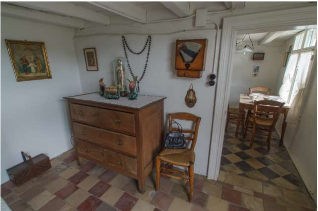
Het interieur van het Huisje Mostinckx (foto's Luc De Cooman)