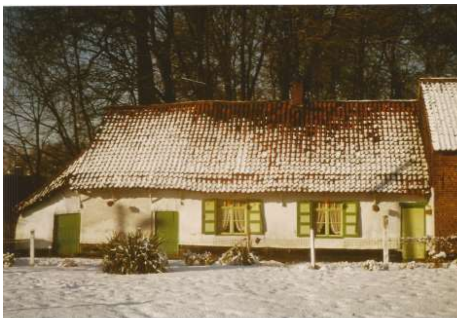
Toestand tijdens de winter van 1979.

Op de warme zomerdag van woensdag 2 juli 1980 nam de 88-jarige Carolus afscheid van zijn tijdelijke bestaan. Het werd plotseling stil en verlaten op en rondom het schilderachtige huisje.