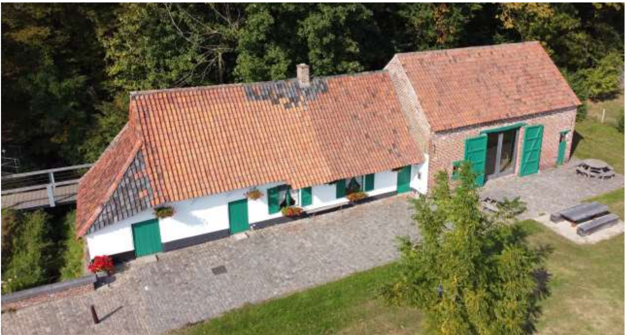
Het Huisje Mostinckx in vogelvlucht.

In 2000 redde de fusiegemeente Dilbeek het historische bouwwerk van de afbraak. Een zeldzame getuige van de traditionele Pajottenlandse leembouw bleef hierdoor voor het nageslacht bewaard.