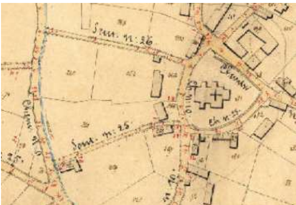
De Bodegemse dorpskern in de Atlas der Buurtwegen uit 1841.