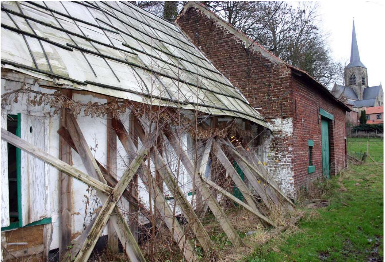
Voorlopige ondersteuning en nooddakbedekking van het lemen huisje ca. 2008.

Het spreekwoordelijke langzame malen van de administratieve molen maakte dat de aanvaarding van het restauratiedossier nog jaren in beslag zou nemen. Uiteindelijk werd het toch in april 2008 goedgekeurd onder Vlaams minister van Financiën Dirk Van Mechelen.