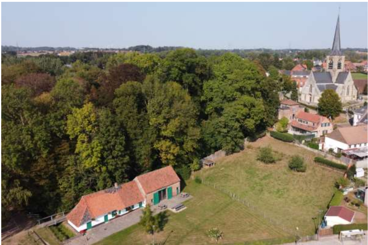
Luchtopname van de Sint-Martinuskerk en het Huisje Mostinckx (foto Hans Van Droogenbroeck, zoon van Edgard).