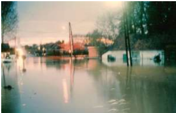
Huisje Mostinckx bij de overstroming van 30 april 1978.

De 86-jarige Sjâlen beleefde op zondag 30 april 1978 de schrik van zijn leven toen in de late namiddag boven het dorp een wolkbreuk losbarstte. In een minimum van tijd liep het hele dorpsplein onder water dat al snel tot onder de vensterdorpels van het Huisje Mostinckx reikte.