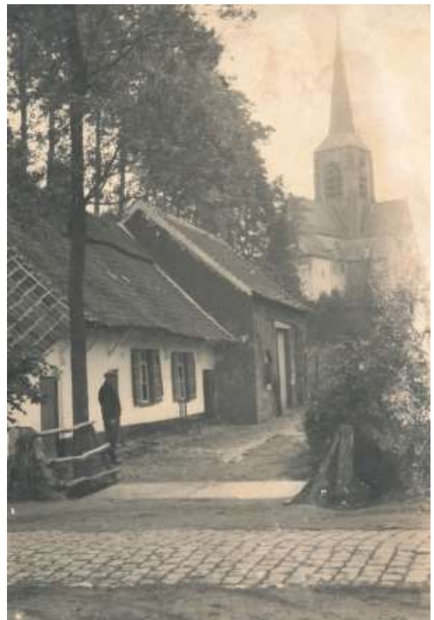
De gekasseide weg die deze foto van ca. 1940 toont, is de Langebroekstraat. Deze straat loopt grotendeels op de oever van de dorpsbeek en fungeerde destijds als een hoofdweg doorheen de gemeente, namelijk voordat de Molenstraat en Stationsstraat werden aangelegd.