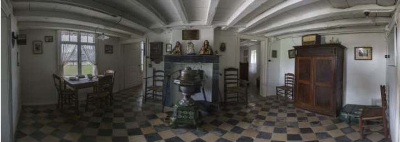
De relatief ruime woonkamer met centraal de Leuvense stoof.