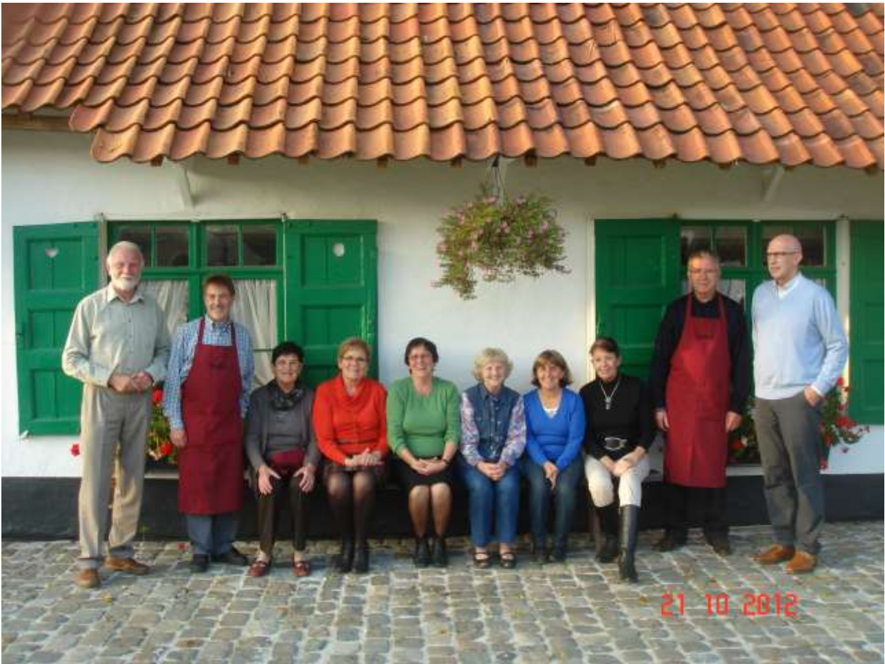
De bestuursleden van de Bodegemse heemkring BKW die tijdens de heuglijke Open Deurdag van 21 oktober 2012 het Huisje Mostinckx openhielden.