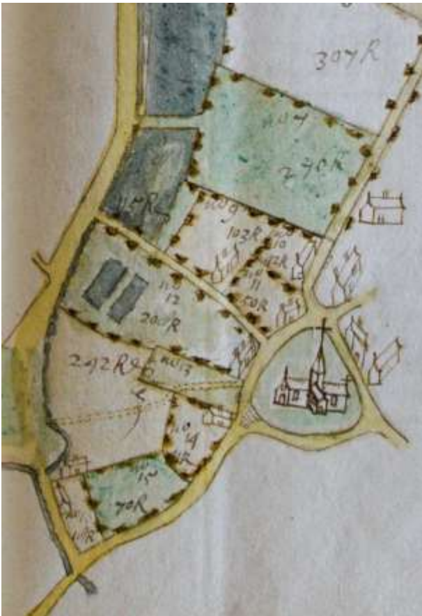
Kaart uit het Metingboek van het Brusselse Sint-Janshospitaal (1708).