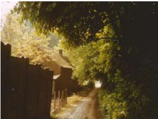
De gekasseide Kerkwegel omstreeks 1978.