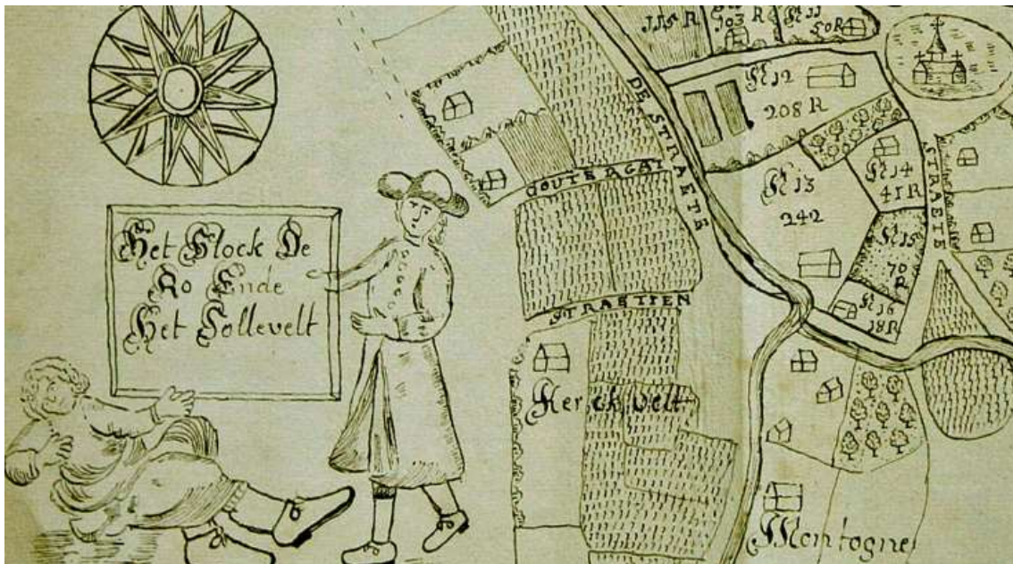
Detail uit de kaart 'Block de Ro' uit 1713 (RA Leuven, best. 51/2-8827)

Het grondstuk nr. 13 wisselde doorheen de tijd dikwijls van eigenaar en onderging vele veranderingen. Van de oorspronkelijke oppervlakte van 242 roeden (76 are) bleef bij de laatste verkoop in 2000 uiteindelijk nog slechts 33 are over.