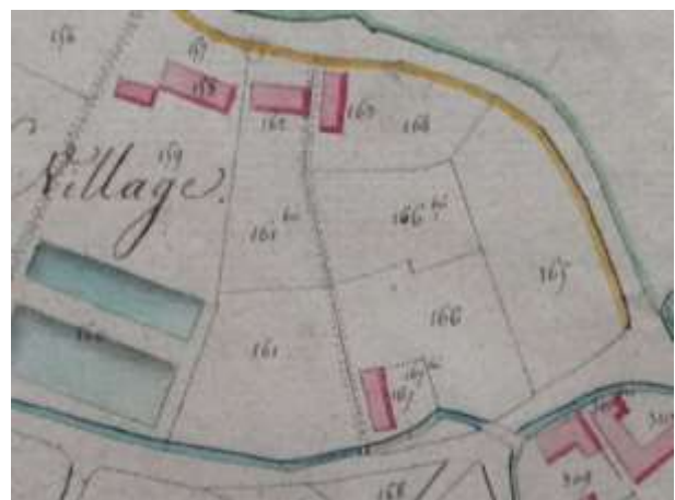
Het Huisje Mostinckx op de Hollandse kadasterkaart van Gullikers (de percelen onderaan, nrs. 166-167).