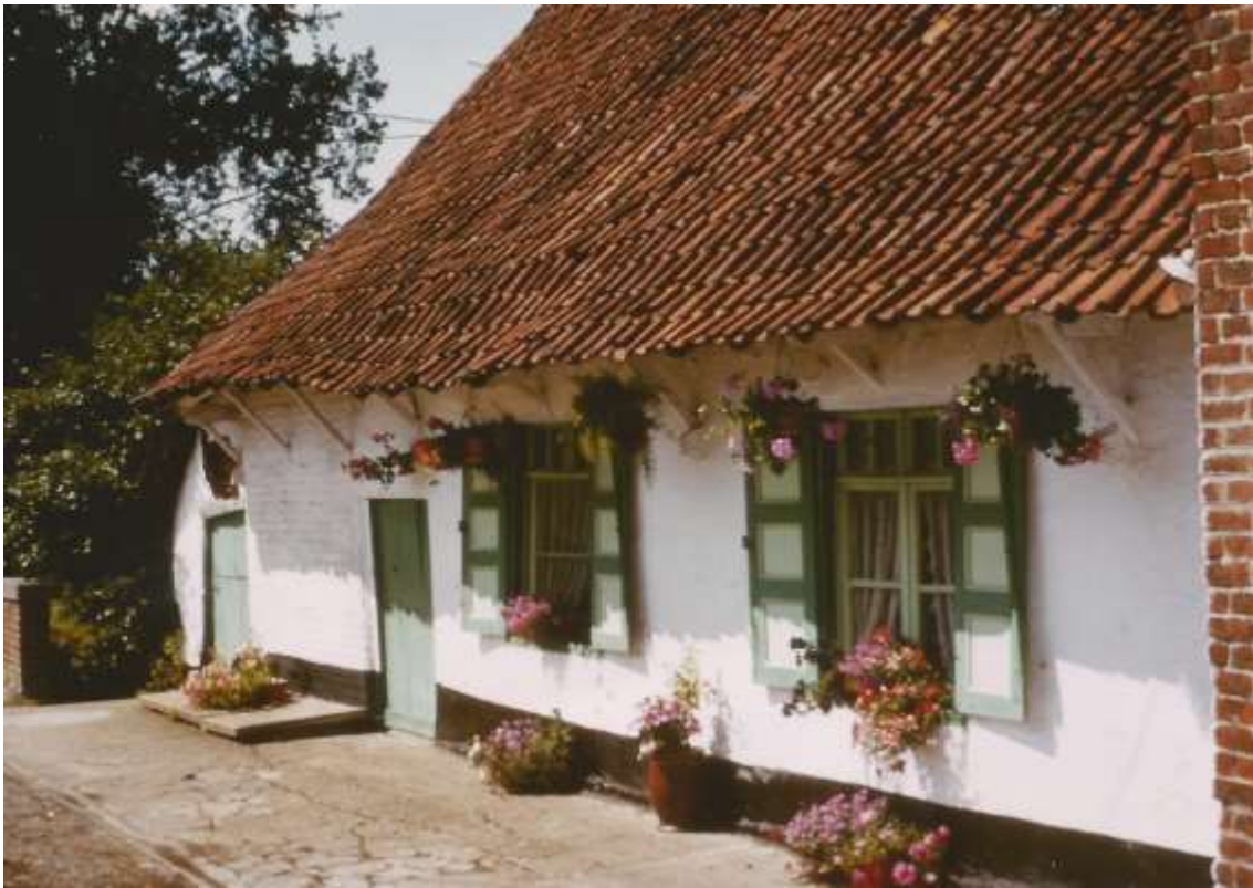
Toestand op 19 augustus 1982.