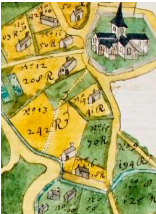
De nog steeds bestaande Kerkwegel aan de achterzijde van het Huisje Mostinckx (in de Atlas der Buurtwegen uit 1841 bekend als Sentier n° 25), doorsnijdt het perceel 13 praktisch middendoor.

De Kerkwegel diende eeuwenlang als voetweg tussen de parochiekerk en den gemeynen driesch, het huidige dorpsplein. (Tiendekaart van het Brusselse Sint-Janshospitaal uit 1712).