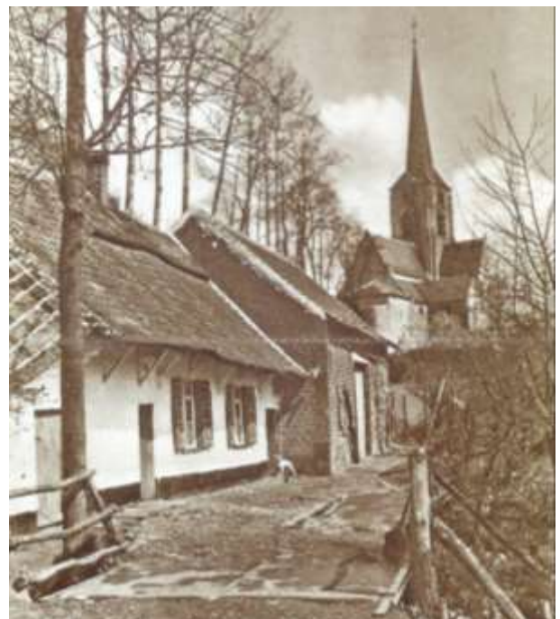
Omstreeks 1939.

gedetailleerde opmeting, het gebruik van oorspronkelijke materialen en de inzet van ambachtelijke technieken heeft men dit gebouw van de teloorgang kunnen redden. Elke laureaat kreeg 2.500 Euro toegekend.