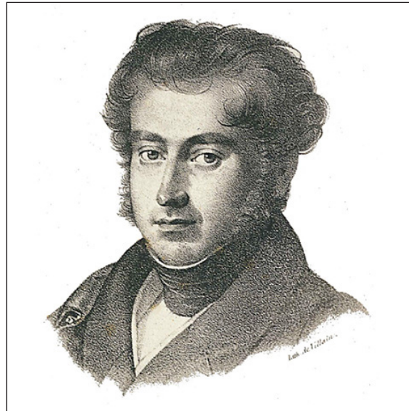
Juan van Halen