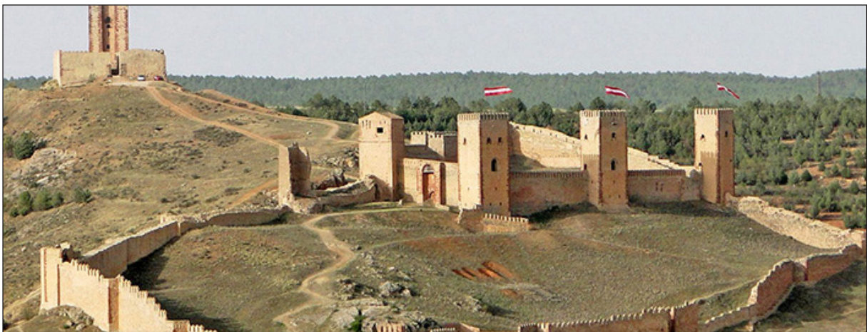
Kasteel te Molina de Aragon