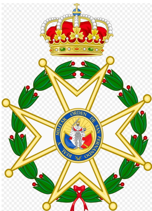
Kruis Orde van San Fernando

Deze bijzondere man, een groot militair, avonturier en hevige verdediger van het liberalisme, bracht zijn laatste levensjaren door in zijn geliefde geboortestreek rond Cadiz in welke stad hij op 76jarige leeftijd overleed op 8 november 1864. Drie dagen later, op 11 november 1864