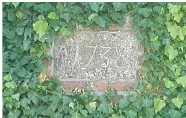
Met de komst van de Van Lierde's wordt het molenhuis vernieuwd en volledig in baksteen opgetrokken. Aan de kant van het waterrad getuigt daarvan de jaarsteen die als bouwjaar 1738 aangeeft.

wezen: waterbantmolen metten molenhuuse ende alle andere sijne toebehoorten daer aen gelegen metten hoff ofte hoplochtinghe gelegen te Voorde. Het pachtgeld bedroeg 270 gulden per jaar en de verbintenis werd aangegaan voor een termijn van negen jaren.