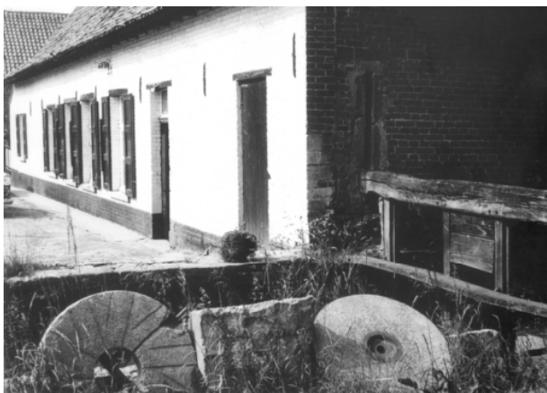
Zicht op het molenhuis van de kant van de Molenstraat omstreeks 1960.