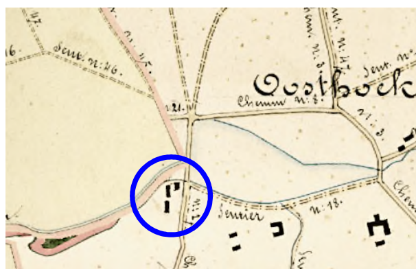
De watermolen en de maalvijver omstreeks 1841 in de Atlas der Buurtwegen. Van de vroegere gracht rond het kasteel en de zuidelijk gelegen visvijver is op deze kaart niets meer te bespeuren.