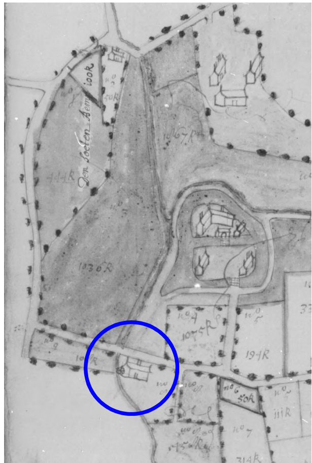
Voorstelling van het omwalde kasteeldomein in het landmeetboek van het Sint-Janshospitaal uit 1708, met links de maalvijver (1036 roeden groot) met onderaan het molenhuis met schetsmatige voorstelling van het waterrad. Op deze kaart ligt het noorden links.